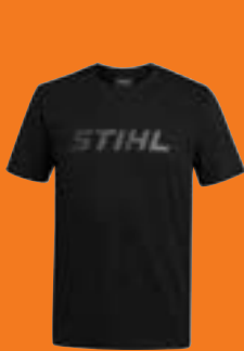
T-SHIRT »BLACK LOGO« HERREN

Das STIHL Fan-T-Shirt ist ein klares Bekenntnis zur Marke, schließlich präsentiert sein Träger das Logo, tonal in Schwarz, stolz auf der Brust. 100 % Baumwolle