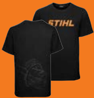
T-SHIRT »MSA 300« UNISEX

STIHL T-Shirt mit dunkelgrauer STIHL MSA 300-Strichzeichnung auf der Rückseite, oranges STIHL Logo auf der Brust. 100 % Baumwolle