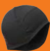
MÜTZE »FUNCTION« UNISEX

Mütze mit orangem Gummi-Logo-Print im Nacken, winddichte Stirnpartie, als Unterziehmütze für Helme im Winter oder als Laufmütze. 92 % Polyester, 8 % Elasthan