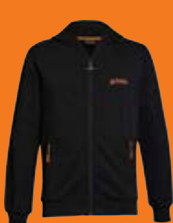
HOODIEJACKE »STIHL« UNISEX

Schwarze Hoodiejacke mit Reißverschluss und STIHL Elasto-Start-Zipper, zwei Reißverschlussaschen, leicht erhabenes STIHL Logo auf der Brust. 100 % Baumwolle