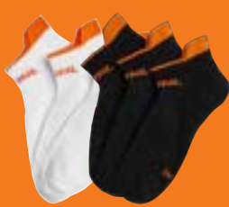
SOCKEN 3ER-SET »SNEAKER« UNISEX

Sneakersocken aus leichtem Materialmix, mit gestricktem STIHL Logo am Einstieg. 80 % Baumwolle, 18 % Polyamid, 2 % Elasthan