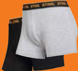
BOXERSHORTS »LOGO« 2ER-SET HERREN

STIHL Boxershorts mit durchlaufendem STIHL Logo auf dem Bund, eng anliegend, im 2er-Set, in Schwarz und Grau. Schwarz: 95 % Baumwolle, 5 % Elasthan; Grau: 85 % Baumwolle, 10 % Viskose, 5 % Elasthan