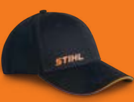
CAP »LOGO« UNISEX

Schwarze Cap mit geformtem Schirm, oranges STIHL Logo auf der Front, kleine Jahreszahl auf der Rückseite, »LEGENDARY PERFORMANCE«-Schriftzug an der Seite des Schirms, Snapback-Verschluss. 100 % Baumwolle