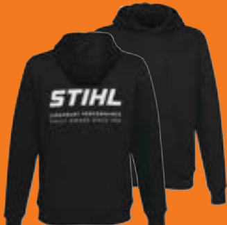
HOODIE »BACK LOGO« UNISEX

Schwarzer Hoodie mit innen aufgetrautem, weichem Sweat-Stoff, zusätzlichen seitlichen Zipper-Taschen in der Bauchtasche, STIHL Logo mit »LEGENDARY PERFORMANCE«-Schriftzug in Weiß auf dem Rücken. 60 % Baumwolle, 40 % Polyester